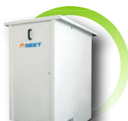
Générateur avec kit vertical extérieur