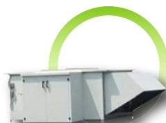
Générateur avec kit horizontal extérieur