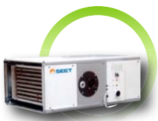
Générateur avec kit horizontal intérieur