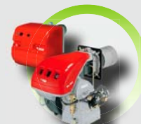
Brûleur 2 allures fioul ou gaz