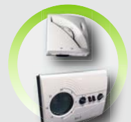
Thermostats 1 consigne ou multiconsignes