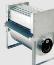
Foyer + échangeur